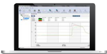
Data Logger Transfer Generación automática de informes